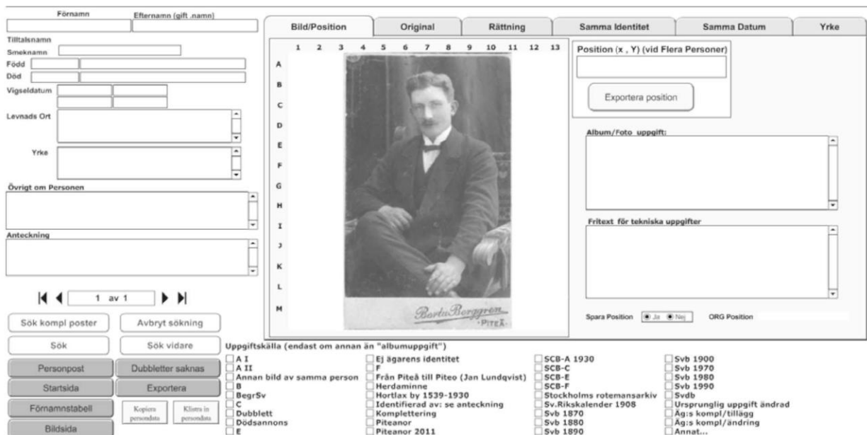
Exempel på sida för personregistrering

Inte minst vem som var vem på bilden ifall det var tre personer på bilden, visade sig vara viktigt. En uppräknig av vilka man såg på bilden kunde bli helt omkastad, för det är inte självskrivet att alla räknar upp namnen på kortet från vänster till höger, och vi börjar med bakre raden först! Det innebar att hämtning av inlämningar tog ganska lång tid, för den noggrannhet som där grundlades, betalade sig i form av mer korrekta uppgifter på de personer som bilderna visade. Både bild på personuppgiftsregistrering och bild på bildkategori (bildens egenskaper), framgår av nedanstående bilder från registreringsprogrammet.